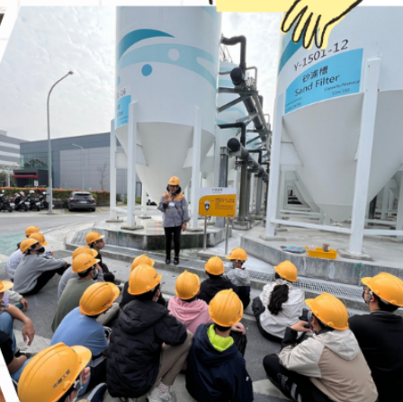
▲ 揭秘護國神山，一探台積電的核心禁區