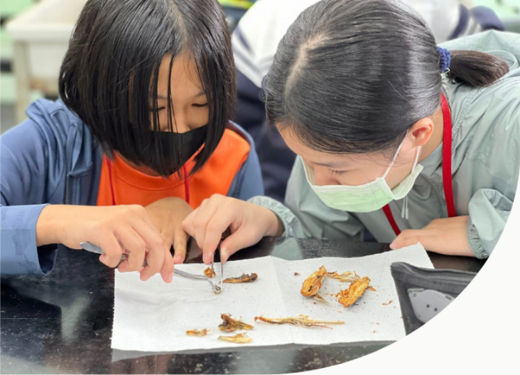
▲鏈結海生館教育資源，專家親授解剖精髓