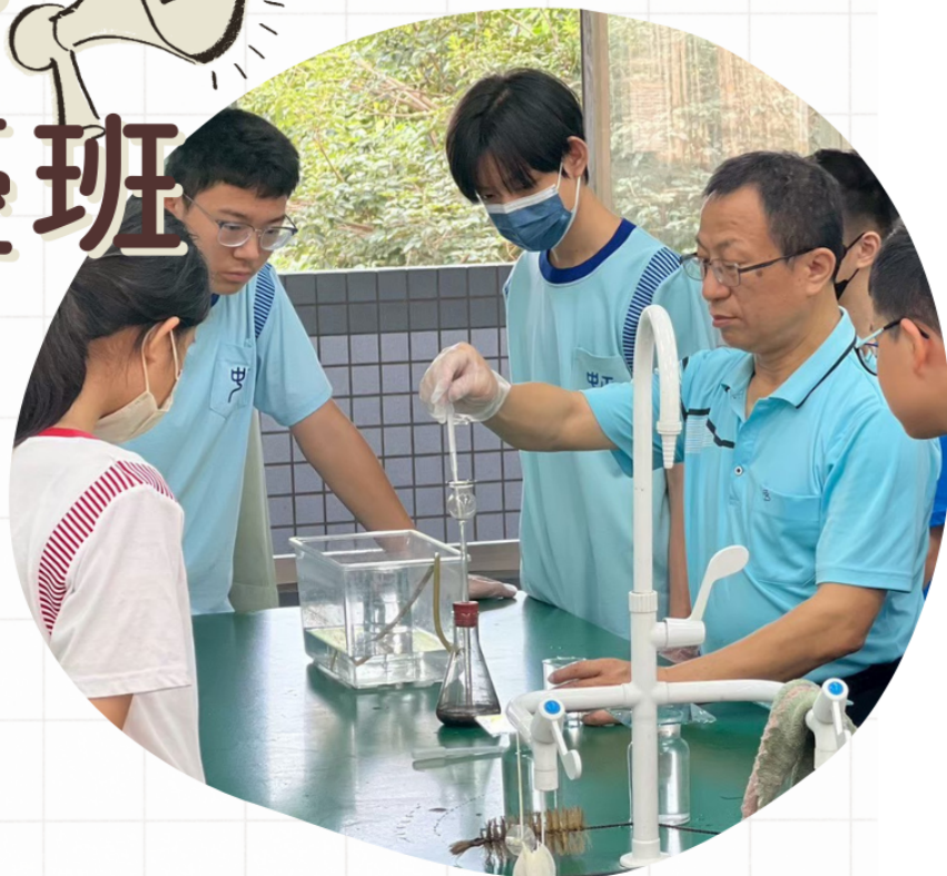
▲ 校內頂尖師資指導，精準銜接高中核心課程