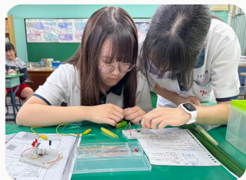
▲會考後的科技洗禮，厚植升學競爭優勢