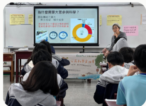
▲安排跨域專題講座，拓展學術視野