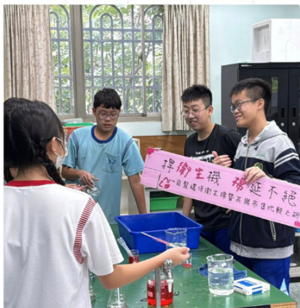
▲ 分享研究成果，精進溝通表達能力