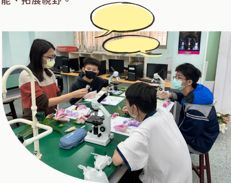
▲科學班甄試特訓，助資優生問鼎頂尖殿堂