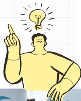
▼ 利用課堂所學，實際解決地區環境問題