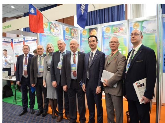
▲ 當地廠商蒞臨台灣展區洽談合作