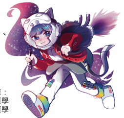
人物繪圖： 高于涵同學 黃仲堃同學