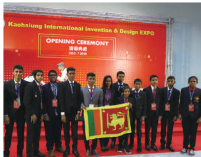
斯里蘭卡 Sri Lanka