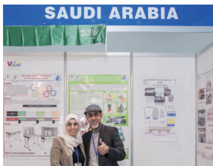
沙烏地阿拉伯 Saudi Arabia