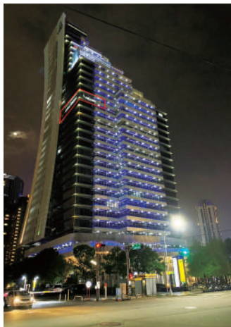
WIIPA 台中七期百坪辦公室