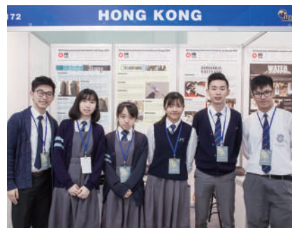
香港 Hong Kong