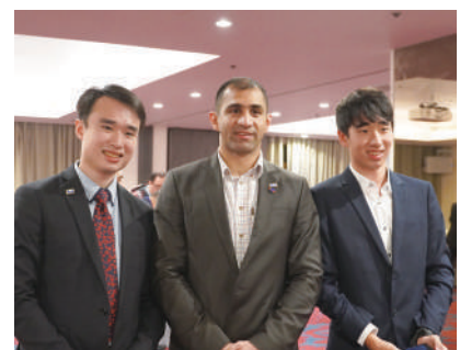
英國 United Kingdom