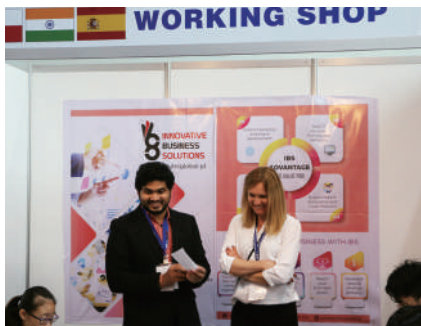
印度 India + 西班牙 Spain