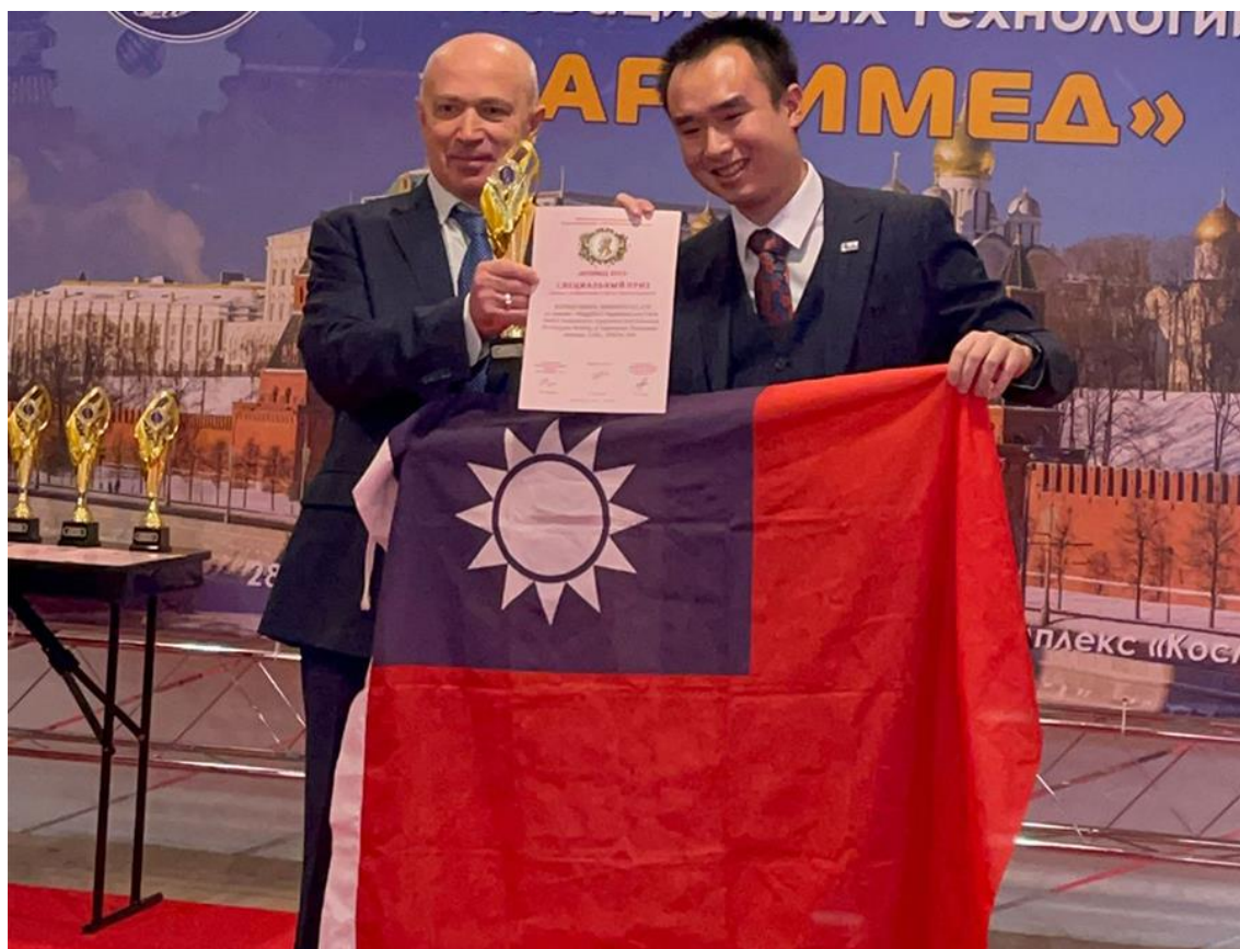
▲ 大會主席 Dmitry Zezyulin 頒發獎項給 TIPPA

格外珍貴的是，參展團隊成員橫跨教育研發單位、生醫界大廠等，作品類別包含生技、醫療、農業技術、生活用品等，創造力豐盛多元，是非常具潛力與實踐力的發明協會，相當期待TIPPA未來帶領更多作品再闖俄羅斯與世界發明平台！