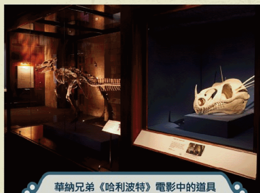
華納兄弟《哈利波特》電影中的道具與現實世界中的文物並陳展示