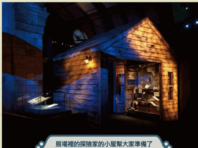
展場裡的探險家的小屋幫大家準備了各式各樣的裝備，大家一起來探險吧。