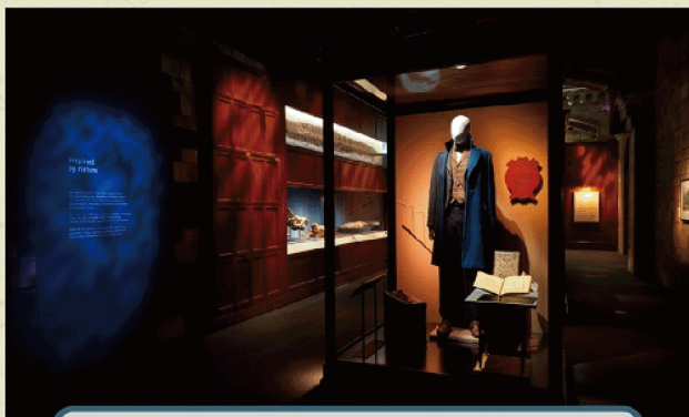
「怪獸與大自然的奇幻世界」特展將於今年暑假強勢登場英國展出內容完整移師來台，不容錯過。