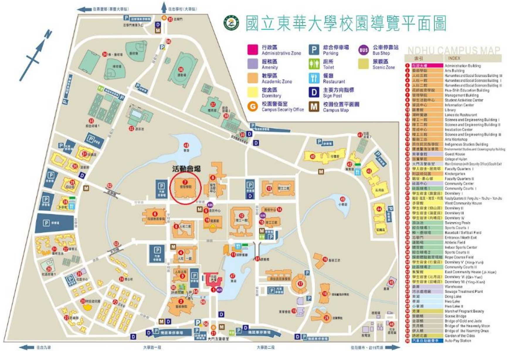
國立東華大學校園地圖