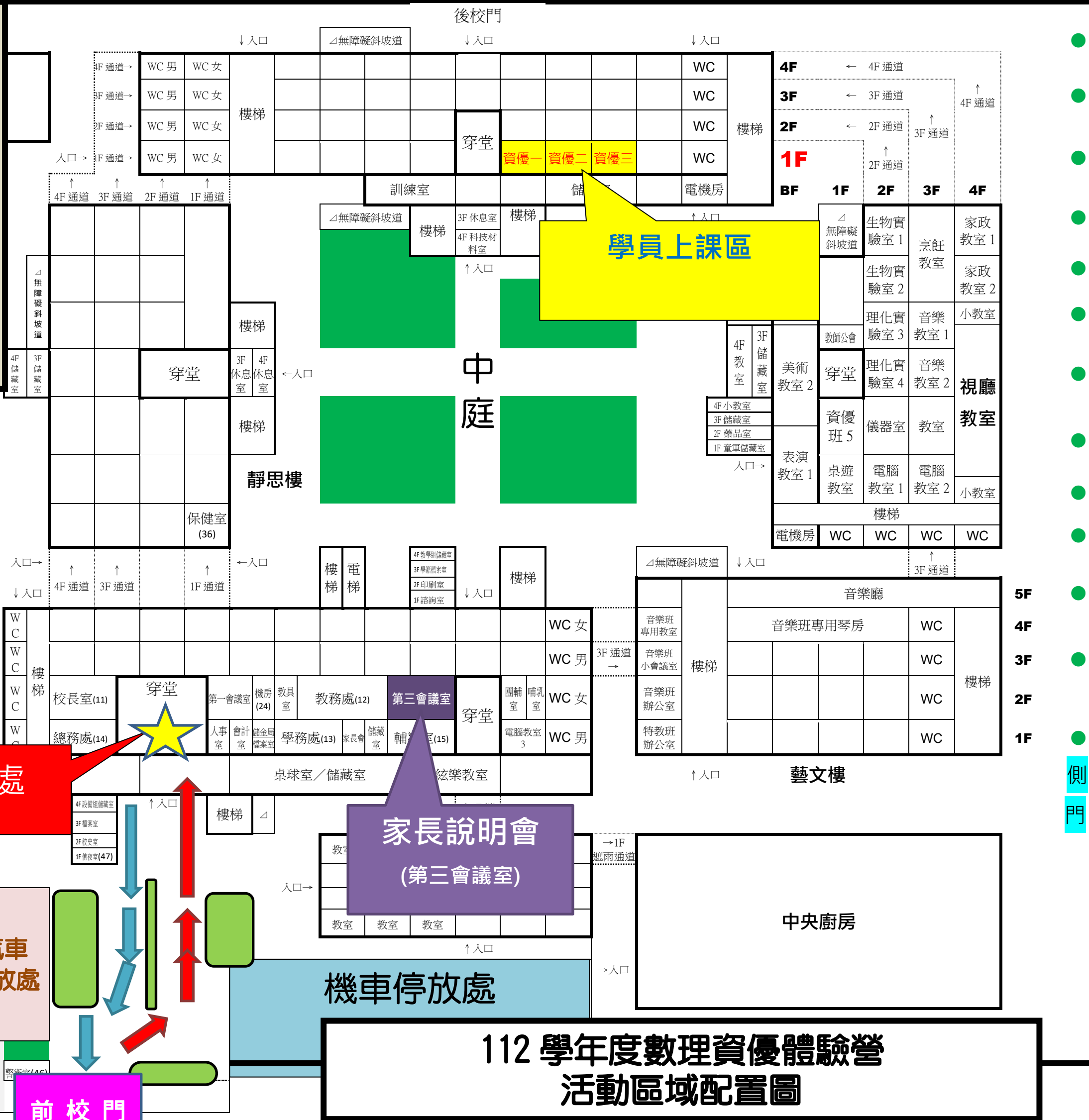
112 學年度數理資優體驗營 活動區域配置圖