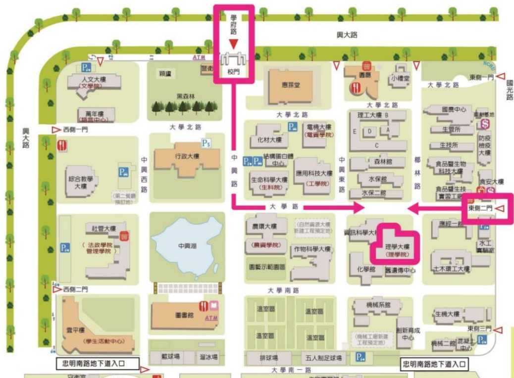
▲中興大學校園平面配置圖