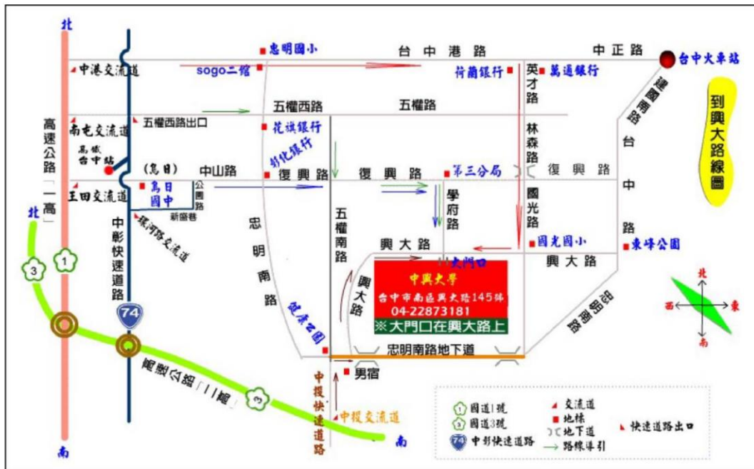
▲中興大學交通路線圖