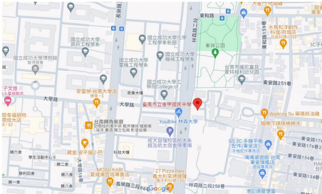
(後甲國中 google 地圖)