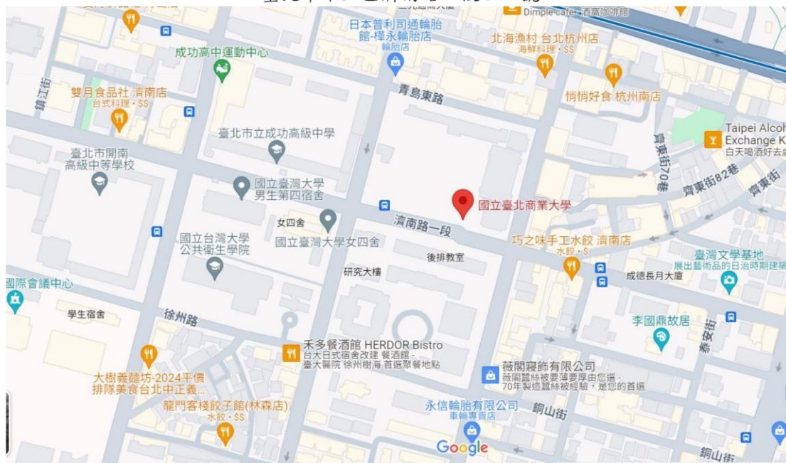
(臺北商業大學 google 地圖)