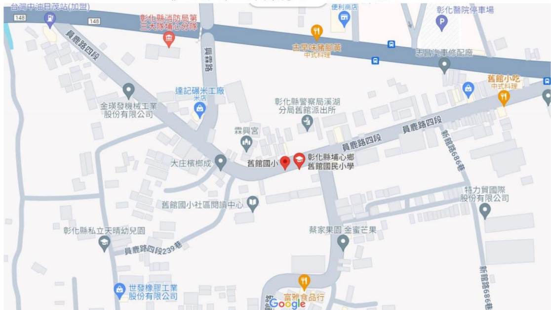
(舊館國小 google 地圖)