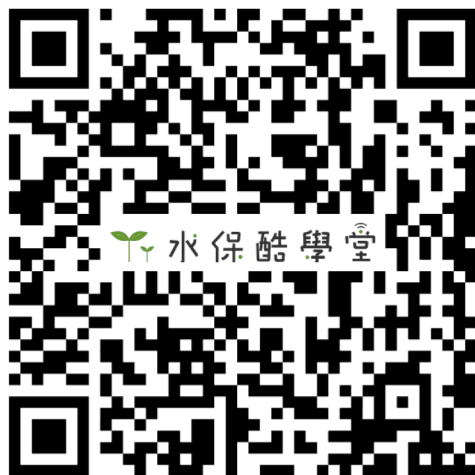
（水保酷學堂網址 QR Code）