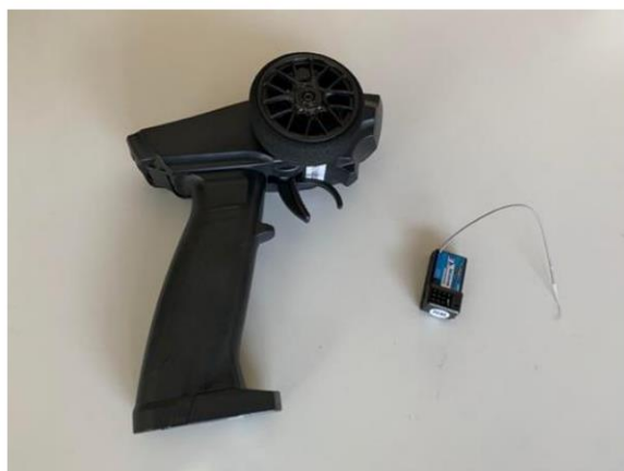
市售 3 通道 2.4GHz 槍型遙控收發器

本競賽禁止使用市售 2 通道、3 通道或多通道之 2.4GHz、27MHz (或其他頻率) 槍型或板型遙控收發器 (或由類似控制元件組合) 作為控制遙控帆船之裝置 (如下二圖所示)，違者以 失格 認定。