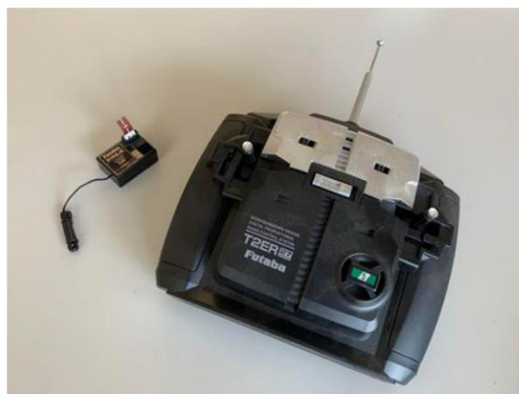
市售 3 通道 27MHz 板型遙控收發器