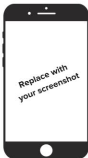
Step 1: (fill in description)

Please provide step-by-step instructions for using your app, along with high-quality screenshots of the app. Feel free to add as many slides as needed.